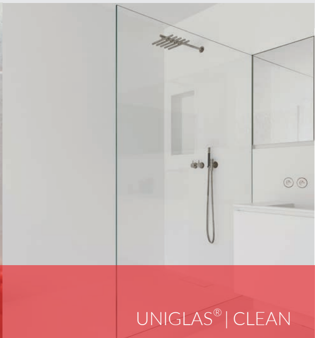
UNIGLAS® | CLEAN

Trotz regelmäßiger Reinigung verliert das Glas von Ganzglasduschen, Duschwänden und Duschkabinen mit der Zeit seine Brillanz. Kleine milchige, raue Stellen entstehen auf der Glasoberfläche, wo sich bevorzugt Kalk, Schmutz und gesundheitsgefährdender Schimmel anlagern können.